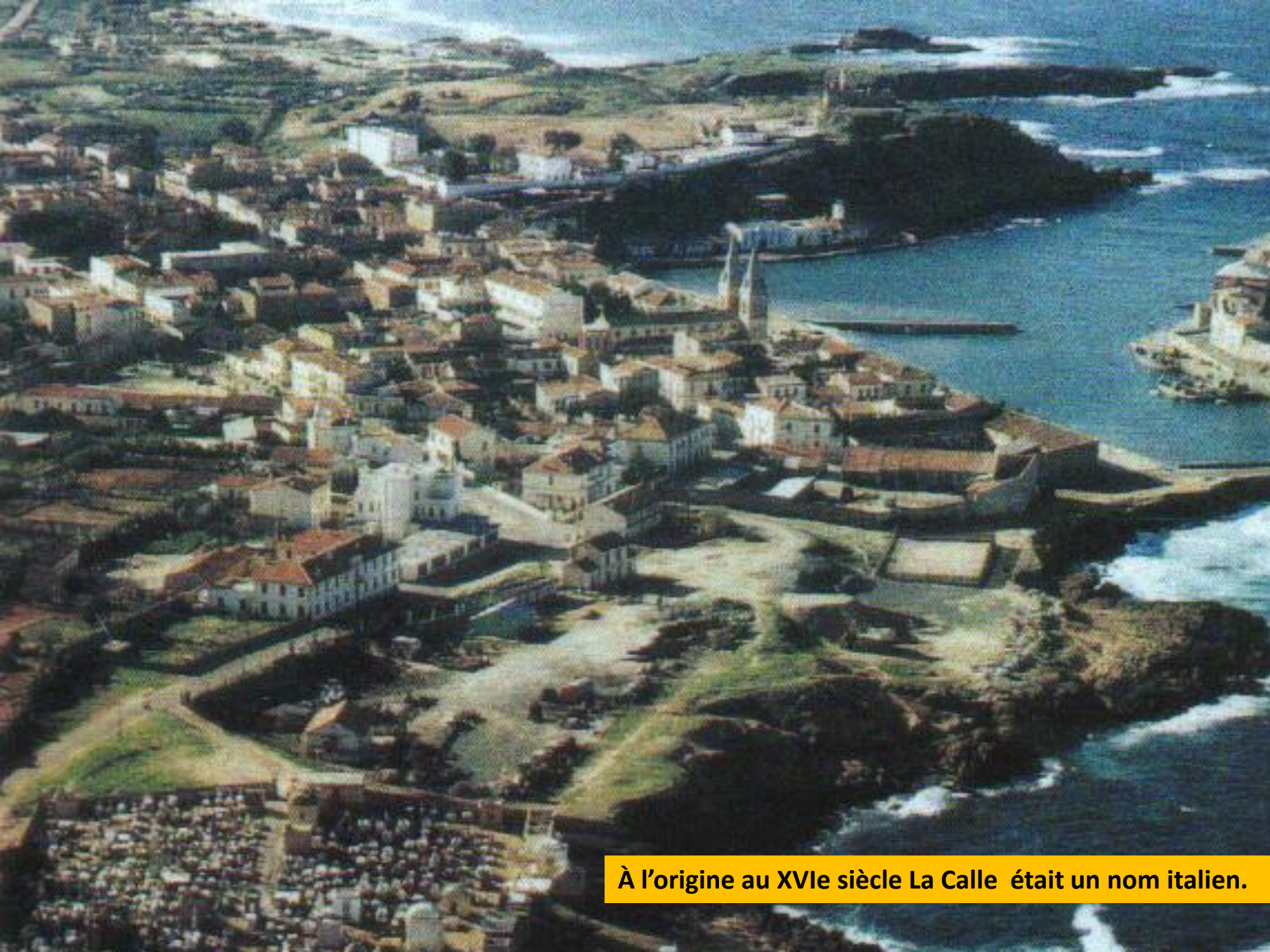
À l'origine au XVIe siècle La Calle était un nom italien.